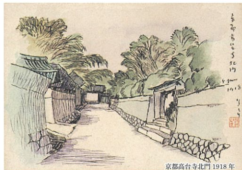
京都高台寺北門 1918年

山の絵では世間が承知しないんだ。 やっぱり女の子の絵しか売れない、悲しいよ。 (望月百合子「竹久夢二」より)