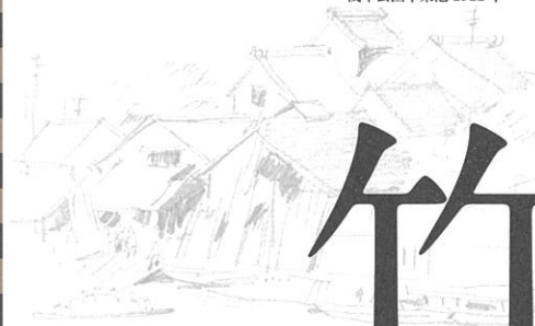
浅草公園千束池 1911年