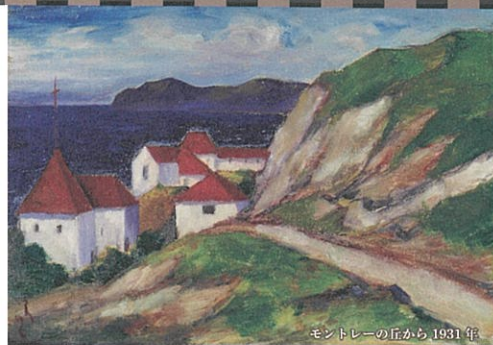
モントレレーの丘から 1931年