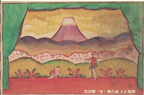
童話劇「春」舞台面 大正後期