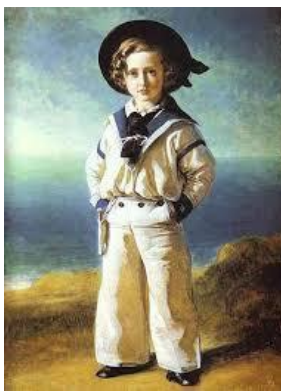
セーラー服人気の火付け役となったイギリスのエドワード皇太子の肖像画

19世紀末～20世紀初頭の欧米で 男児服、女児服、大人女性のマリニルックとしても流行したセーラー服