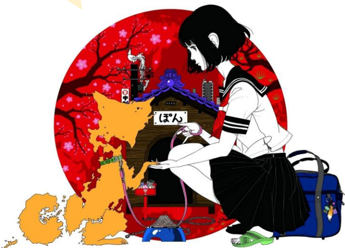
図版⑦ 中村佑介／画 「ニッポン」2017年描き下ろし

武内直子(漫画家) 「日本の制服が日本発 のファッションであると受 け入れられているならと てもうれしい事です」