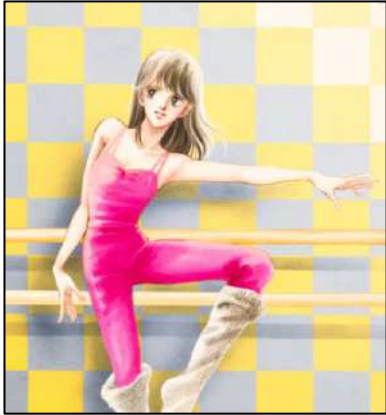
④「ダンシング・ゼネレーション」 LPレコードジャケット原画 1982年 ©榎村さとる／集英社