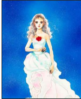
⑤「白のファルーカ」 (集英社) 1巻カバー原画 ©榎村さとる／集英社