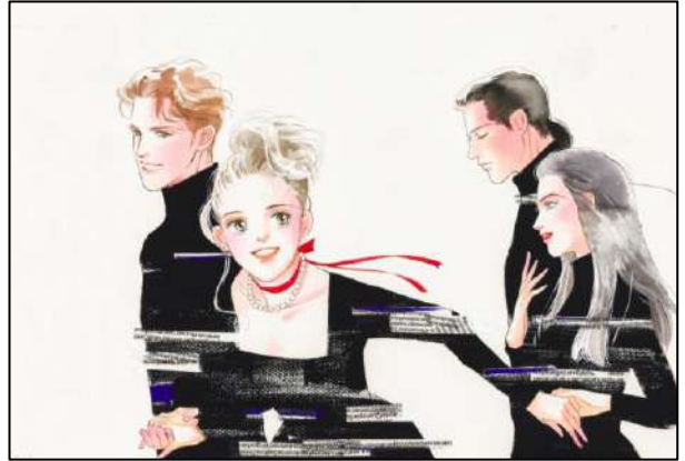
⑥「おいしい関係」 『YOUNG YOU』（集英社）1995年12月号扉原画 ©榎村さとる／集英社