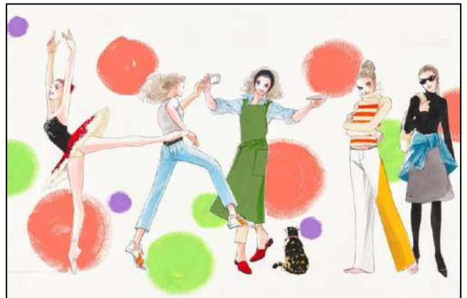
⑧「Do Da Dancin'！」 『YOUNG YOU COLORS ROSSO』（集英社）扉原画 2003年1号 ©榎村さとる／集英社