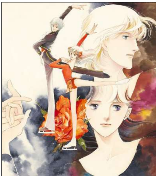
②「 愛のアランフェス 」 『別冊マーガレット』（集英社）1979年12月号 口絵原画 ©榎村さとは／集英社