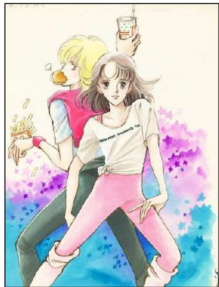
③「 ダンシング・ゼネレーション 」 単行本（集英社）1巻カバー原画 1982年3月 ©榎村さとは／集英社