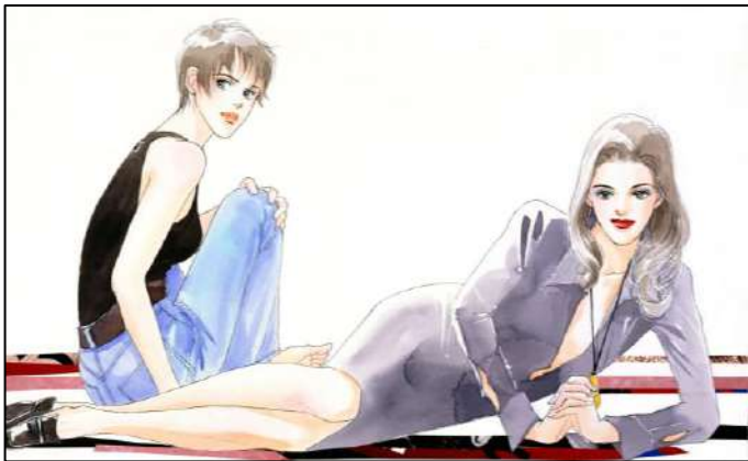
⑦「イマジン」 『コーラス』（集英社）1996年9月号扉原画 ©榎村さとる／集英社