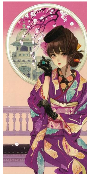
図版③ 「丸窓」 カレンダー 2017年 原画

和装の女性像は着物の柄、着付け、小物、アクセサリ、メイク、髪型に至るまで、本人が創意工夫を凝らして描き出したもの。アンティーク着物愛好家からの注目も集めています。クラシクな洋装を描くことも得意とします。最新作では1900年～1990年までのランジェリーの歴史にも挑んでいます。