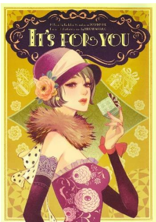
図版⑤ 同人誌 「IT'S FOR YOU」より 2013年

同人誌制作からキャリアをスタートさせたマツオヒロミ。絵を描くだけでなく、誌面のレイアウト、文章、文字の入れ方、ロゴにまでこだわって作画しています。