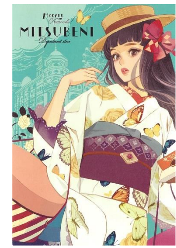
図版⑨同人誌「百貨店ワルツ」 ポストカード 2014年