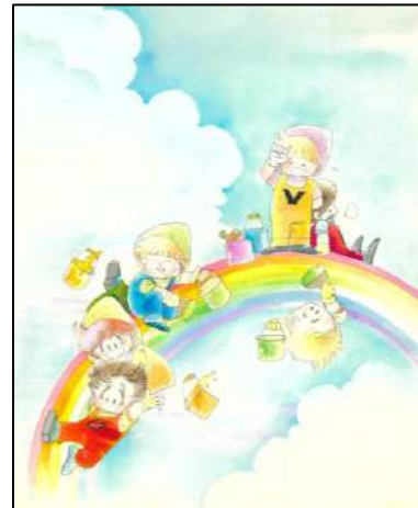
⑨ 「レインボーフェアリーレポート」 『りぼん』6月号(1981年) ふろく ◎ 太刀掛秀子 / 集英社