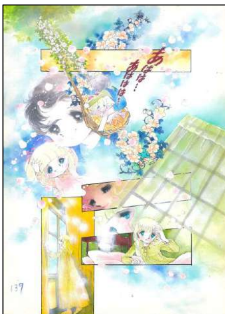
◎ ⑤ 「花ぶらんこゆれて…」 『りぼん』 10月号 カラーページ（1978年） ◎ 太刀掛秀子／集英社

太刀掛のコマ割りは、複雑に進化した少女漫画コマ表現の例として、漫画研究者から度々注目されています。時間の経過と感情の動きを多層的に表現しており、作品をドラマチックに演出しています。