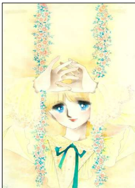
◎ ④ 「花ぶらんこゆれて…」 『りぼん』 5月号 扉 ◎ 太刀掛秀子／集英社