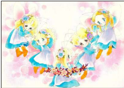
⑧ 「フェアリーしたじき」 『りぼん』4月号(1980年) ふろく ◎ 太刀掛秀子 / 集英社