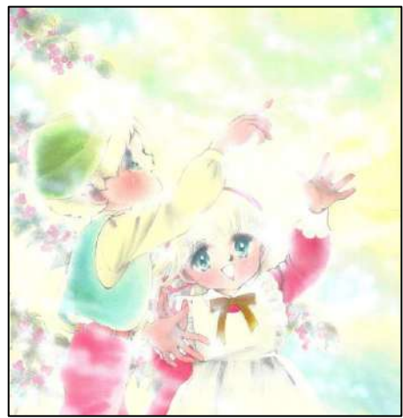
⑦ 絵本「青い鳥」(1983年) ◎ 太刀掛秀子 / 集英社

1980年代に入ると、線の描き方が洗練され、細い繊細なタッチへと変化しています。カラーイラストの着彩も熟達し、淡い色を組み合わせたグラデーションの美しさに目を奪われます。