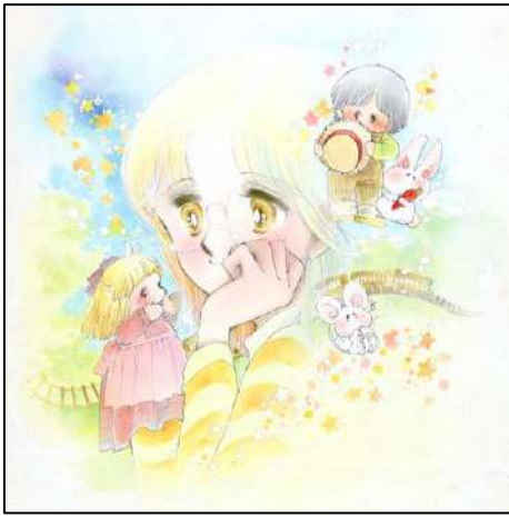
⑥ 「まりのきみの声が」 『りぼん』4月号(1980年) 表紙 ◎ 太刀掛秀子 / 集英社