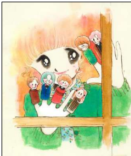
◎ ③ 「なっちゃんの初恋」 コミックスカ バー（1977年）