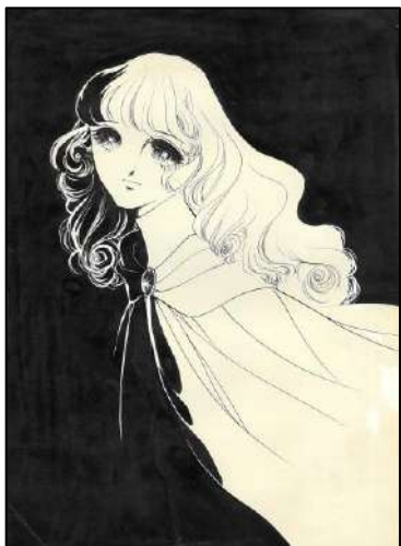
◎ 号② 「雪の朝」 『りぼん』 扉（1973年） 10月大増刊 ◎ 太刀掛秀子／集英社