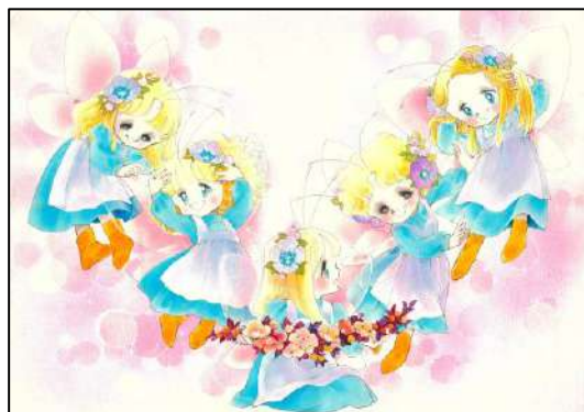
⑧「フェアリーしたじき」『りぼん』4月号(1980年) ふろく ◎太刀掛秀子／集英社