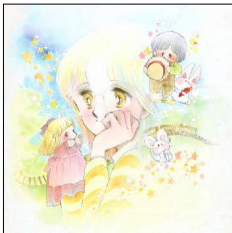
⑥「まりのきみの声が」『りぼん』4月号(1980年) 表紙 ◎太刀掛秀子／集英社