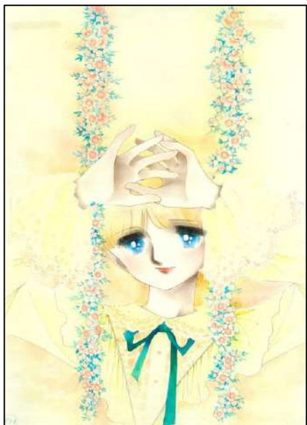
◎ 刊④ 号 屏 「花ぶらんこゆれて…」 『りぼん』 5月号 太刀掛秀子／集英社