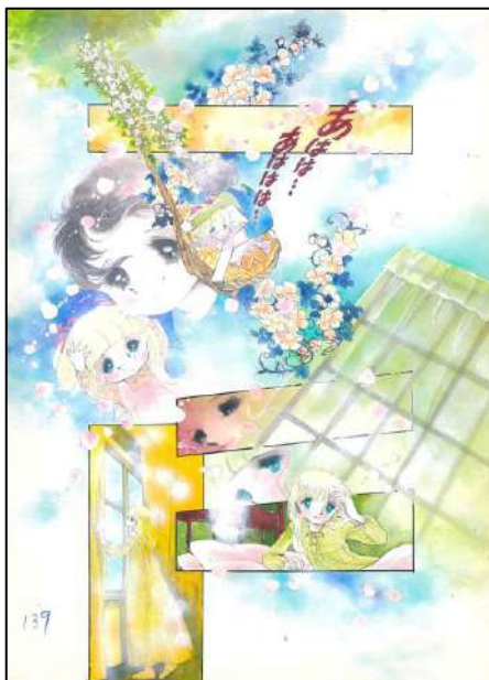
◎ 刊⑤ 号 屏 「花ぶらんこゆれて…」 『りぼん』 10月号 太刀掛秀子／集英社

太刀掛のコマ割りは、複雑に進化した少女漫画コマ表現の例として、漫画研究者から度々注目されています。時間の経過と感情の動きを多層的に表現しており、作品をドラマチックに演出しています。