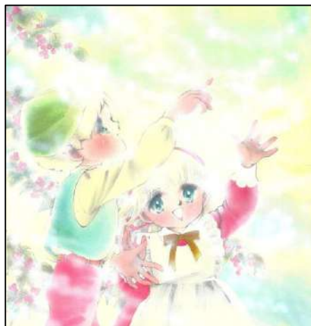
⑦絵本「青い鳥」(1983年) ◎太刀掛秀子／集英社

1980年代に入ると、線の描き方が洗練され、細い繊細なタッチへと変化しています。カラーイラストの着彩も熟達し、淡い色を組み合わせたグラデーションの美しさに目を奪われます。